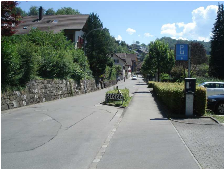
Foto 3: Die Winkelstrasse wirkt für die Amphibien als Todesfalle. Wandermöglichkeiten für Amphibien vom Hang zum Ried und umgekehrt, sind durch harte Verbauungen fast ausgeschlossen.

Bemerkungen zur Tabelle: In der Statistik werden auch Kreuzkröte und Geburtshelferkröten aufgeführt. Vorkommen dieser Arten sind im Gebiet nicht bekannt. Da wird es sich wahrscheinlich um Fehlansprachen handeln.