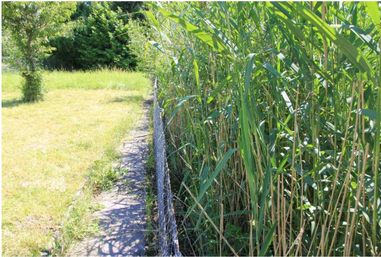
Foto 4: Heute wird das Ried gegen den Projektperimeter hin durch eine Betonmauer abgegrenzt. Für die Amphibien vom Ried her kaum überwindbar.