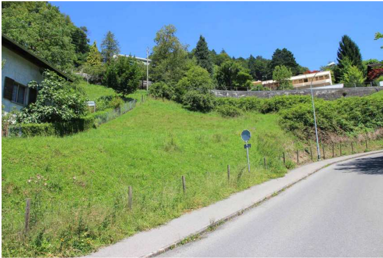
Foto 2: Der Hang nördlich des Projektgebietes bietet Landlebensräume für Amphibien