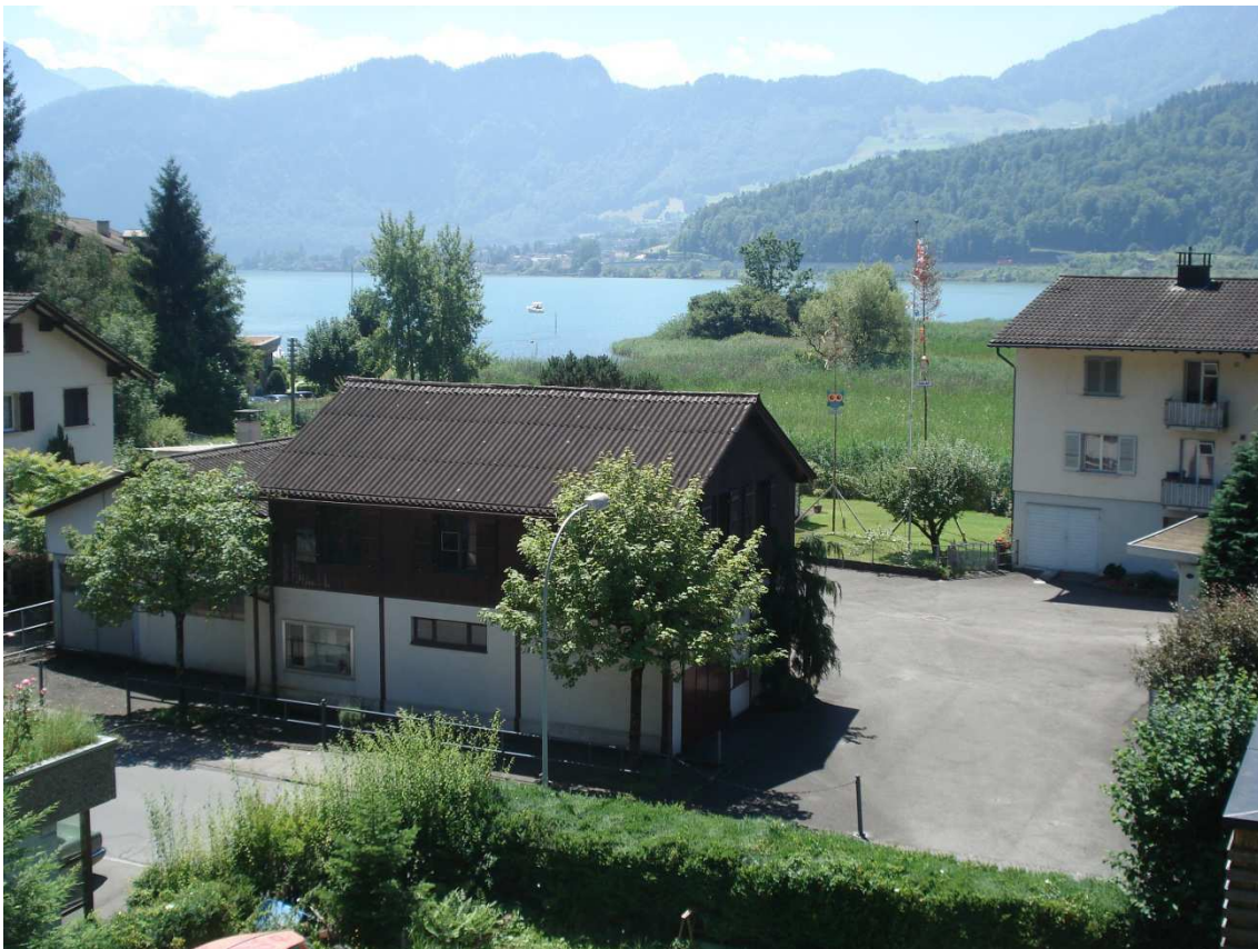
Foto 1: Blick vom Hang Richtung Projektgebiet, Ried im Hintergrund