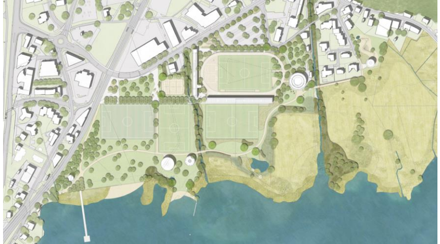
«Vision Seefeld» vom 17. Januar 2023 – Plan Umsetzung langfristig; Quellen: bbz landschaftsarchitekten gmbh, Joos & Mathys Architekten AG, Plangrün AG.

Die Weiterentwicklung des Areals «Seefeld» ist damit in einem umfassenden planerischen und politischen Entwicklungsprozess entstanden, in dem zahlreiche Beteiligte und ihre Anliegen integriert werden konnten.