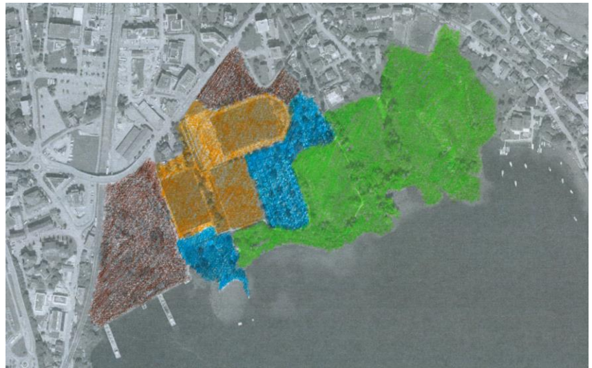
Verschiedene Themen, Nutzungen und Funktionen im Gebiet «Seefeld» im heutigen Zustand, Bearbeitung: Planteam S AG.