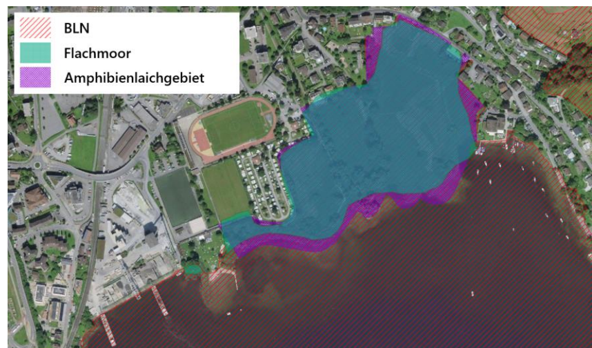
Bundesinventare im Gebiet Seefeld; Quelle: Karten der Schweiz, Geokatalog ( map.geo.admin.ch ); Bearbeitung: Planteam S AG.

Das geplante Vorhaben zur Umsetzung der «Vision Seefeld» ist kein UVP-pflichtiges Vorhaben. Das mehrfach geschützte Steinibachried und der angrenzende Vierwaldstättersee sind jedoch von negativen Umwelteinflüssen zu verschonen. Durch den Rückbau des Campings sowie diverser bestehenden Bauten, Anlagen und Wegverbindungen, durch die naturnahe Gestaltung der see- und riednahen Bereiche und durch die zurückhaltende und landschaftsverträgliche Platzierung