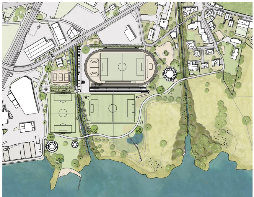
Vorprojekt «Seefeld Horw Luzern» vom 23. November 2022 – überarbeitete Wettbewerbseingabe; Quellen: bbz landschaftsarchitekten gmbh, Joos & Mathys Architekten AG, Plangrün AG.

Das Seefeld ist für Horw ein wichtiger, prägender und identitätsstiftender Ort. Einerseits als zentrumsnaher Freiraum mit direktem Seeanstoss für Freizeit, Sport und Erholung, andererseits als Naturschutzgebiet und Amphibienlaichgebiet von nationaler Bedeutung. Das Gebiet soll in den nächsten Jahren etappenweise weiterentwickelt werden, wobei die heute bereits vorhandenen Funktionen mit ökologischem und gesellschaftlichem Wert allesamt gestärkt werden. Anstoss für diesen Entwicklungsprozess bildete der Ablauf des Pachtvertrages mit dem Campingplatz. Die Gemeinde lancierte vorausschauend einen Studienauftrag mit Präqualifikation. Aus insgesamt 25 unabhängigen, interdisziplinär zusammengesetzten Teams wählte die Jury 5 Teams zur Teilnahme am Studienauftrag aus. Das Siegerprojekt der bbz landschaftsarchitekten gmbh, der Joos & Mathys Architekten AG und der Plangrün AG weist einen hohen Detaillierungsgrad auf und macht bereits sehr konkrete Aussagen, beispielsweise hinsichtlich Architektur, Materialisierung und Möblierung. Das anschliessend erarbeitete Vorprojekt fokussiert sich, dem ursprünglichen Perimeter entsprechend, auf ein Teilgebiet des «Seefeld». Im Rahmen der Teilrevision der Ortsplanung wurden aufgrund des mittel- und langfristigen Bedarfs an Erholungsraum weitere angrenzende Grundstücke einer Zone für öffentliche Zwecke zugewiesen und so der Perimeter erweitert. Ergänzend zum Vorprojekt wurde die «Vision Seefeld» über das gesamte Gebiet Seefeld weiterentwickelt.