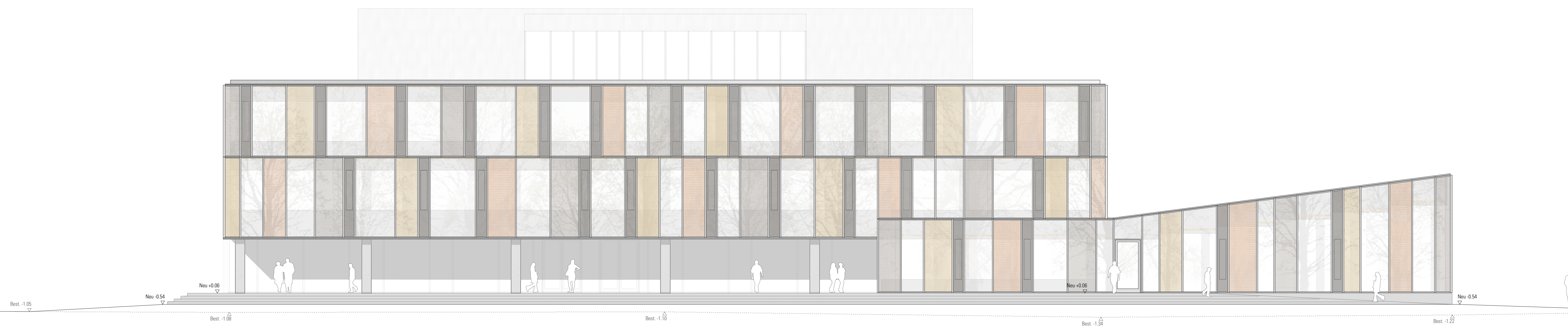
Ansicht 42-1 Süd-Ost