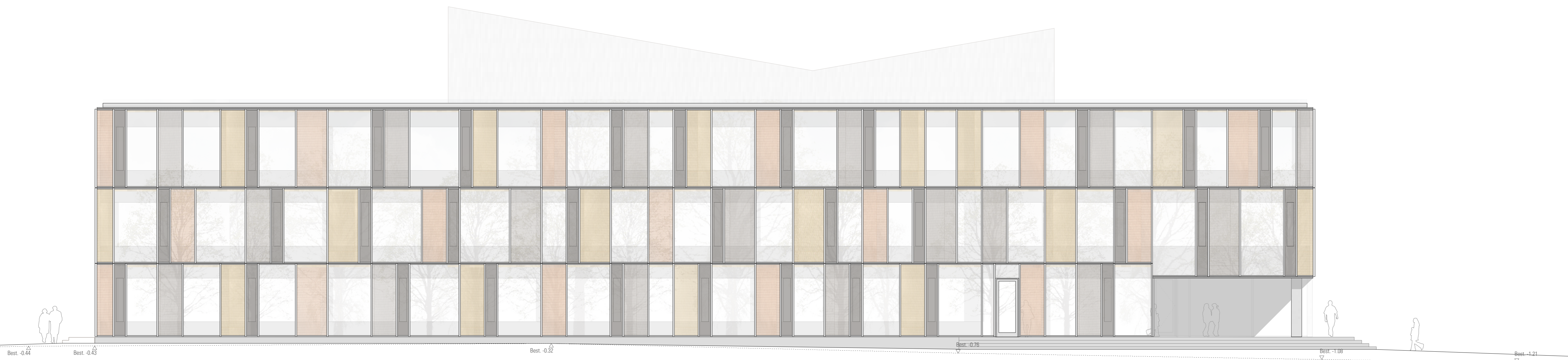
Ansicht 44-1 Süd-West