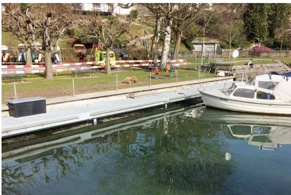
Die Arbeiten im Aussenbereich des Strandbads sind noch in vollem Gang, während das Restaurant bereits wieder offen ist (oben). Beim Sternenmätteli ist die Ufermauer bereits saniert (unten).

Beim Sternenmätteli und dem Strandbad Winkel sind während den Wintermonaten diverse Erneuerungsarbeiten ausgeführt worden. Da die bestehenden Ufermauern massive Senkungen und Schäden aufwiesen, wurden ab Dezember 2016 die Mauern teilweise erneuert oder zusätzlich verstärkt und die Pfeiler des Schwimmstegs ersetzt.