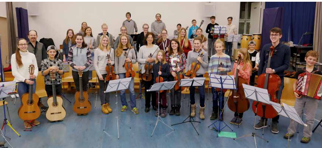
Das Musikschulorchester beim ersten Auftritt in der Reihe Komponistenporträt, an dem das musikalische Schaffen der Band ABBA vorgestellt wurde.

Neue Studien belegen, wie positiv sich Musik auf die Entwicklung und Förderung von Jugendlichen auswirkt. Doch welches ist das ideale Alter bei Kindern für die Musikschule? Und welches Instrument ist das «richtige» für Ihr Kind? An einem Tag erlebt man mehr als 30 verschiedene Instrumente, kann diese ausprobieren und die Faszination von selbst erzeugten Klängen erleben.