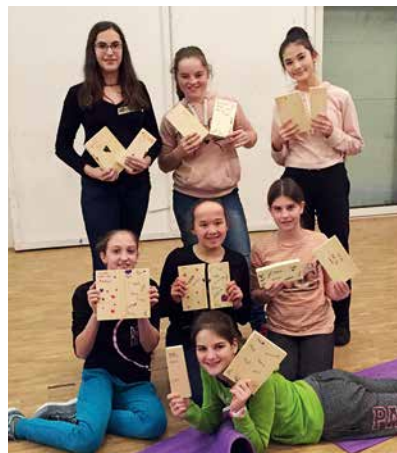
Die Teilnehmerinnen sind stolz, mit blosser Hand das Holzbrett zerbrochen zu haben. Dies war Teil des Selbstbehauptungskurses.

Die Jugendarbeit Horw organisiert für Jugendliche der ersten Oberstufe Selbstbehauptungskurse. Eine Mädchen- und eine Jungengruppe haben im Wen-Do und Maru Dojo gelernt, ein gutes Selbstwertgefühl zu haben und sich verbal und körperlich zu verteidigen. Themen der Kurse waren unter anderem, sich selber besser wahrnehmen, Umgang mit eigener Kraft und Energie, sich selber schützen können, Grenzen setzen. Das grosse Highlight bei den Mädchen war das Zerbrechen eines 3 Zentimeter dicken Holzbrettes mit der eigenen Faust. Auch in den kommenden Jahren sollen ähnliche Kurse wieder stattfinden.