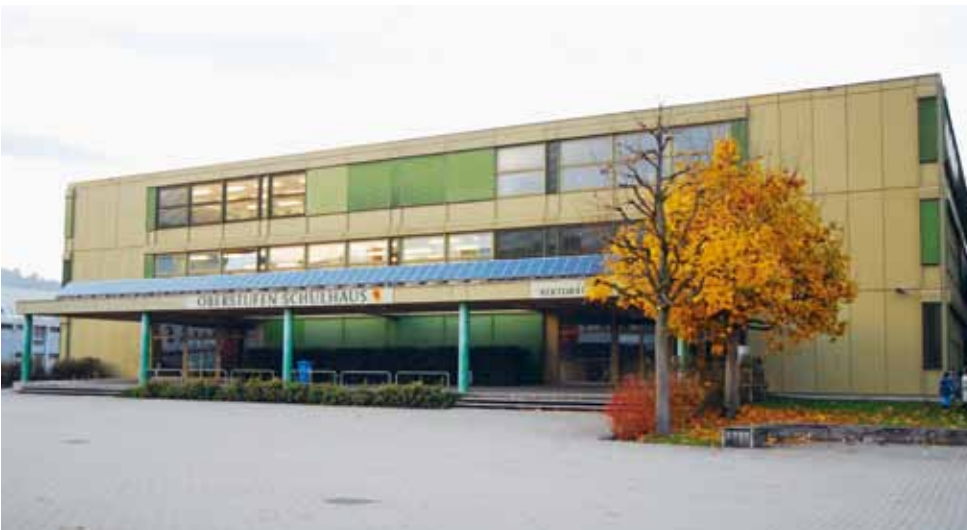
Die Bausubstanz des Oberstufenschulhauses ist schlecht, der Handlungsbedarf ist unbestritten.

Details zu einzelnen Kursen und das ganze Jahresprogramm unter www.schulen-horw.ch / Schulnahe Angebote / Elternschule