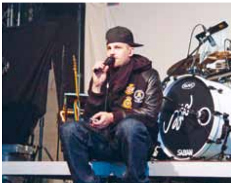
Samstag, 17.05 Uhr: Headliner Stress checkt Mic, Technik, Akustik und Beleuchtung.