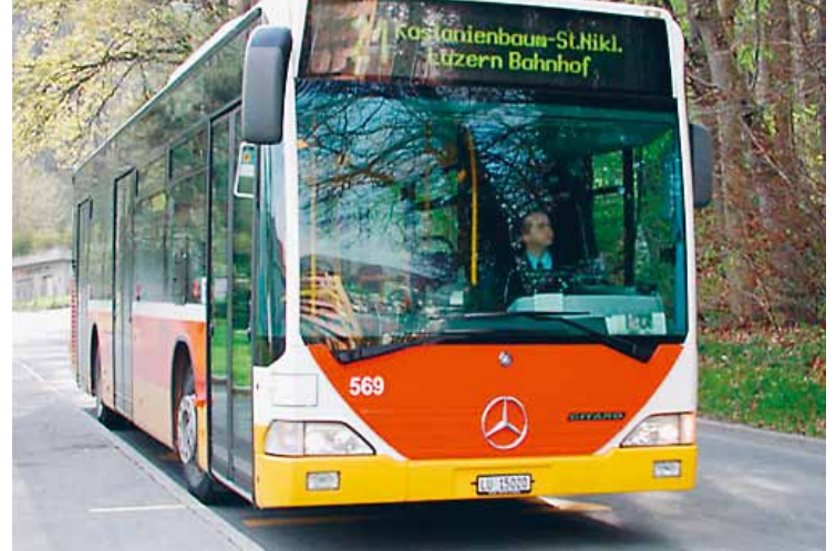
Die Linie 21 im Wandel der Zeit: 50 Jahre liegen zwischen der ersten Fahrt und dem heutigen modernen Linienbus.