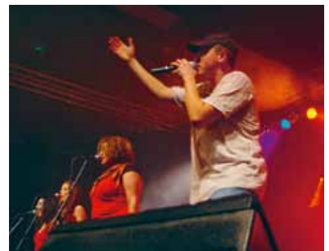
Samstag, 22.48 Uhr: Mundart-Reggae-Sänger Phenomden begeistert.