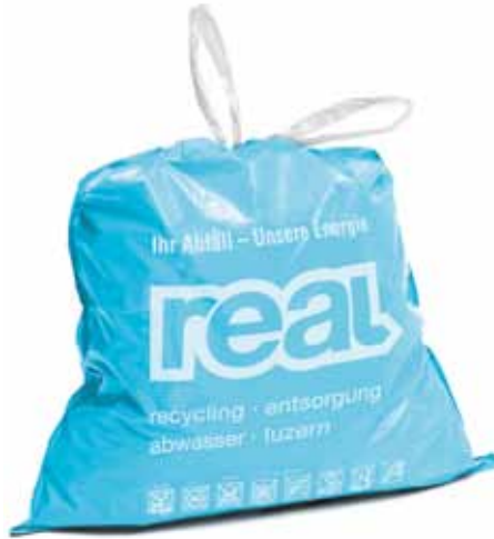
So sieht der neue Güsselsack aus, den der Verband REAL den Gemeinden zur Verfügung stellt.

Ab 1. Januar 2010 gibt es neue Gebührensäcke: Blau mit der Aufschrift «real» statt die bisherigen grauen Säcke. Ebenfalls neu gestaltet werden die Sperrgutmarken. Ab Januar 2010 sind nur noch diese erhältlich. Die bisherigen Gebührensäcke und Sperrgutmarken sind aber weiterhin gültig. Es kommt immer wieder vor, dass Sperrgutmarken auf schwarze Kehrichtsäcke geklebt werden. Wenn die Kehrichtequipe vermeintlich illegale, schwarze Säcke aussortiert, auf der aber doch eine Sperrgutmarke klebt, ist das sehr mühsam und zeitraubend. Ebenfalls ist die Gefahr gross, dass die Marke unterwegs verloren geht. Somit gilt: Alles, was in Säcke passt, muss in den offiziellen Gebührensäcken entsorgt werden.