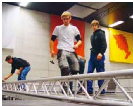
Freitag, 19.25 Uhr: Beim Bühnenaufbau legen freiwillige Helfer Hand an.