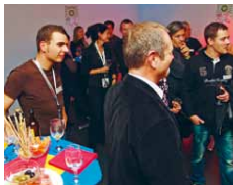
Samstag, 21.22 Uhr: OK-Mitglieder und Sponsoren haben Grund zum Anstossen.