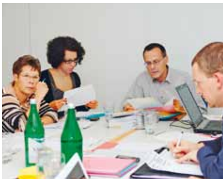
Mittwoch, 17.30 Uhr: An der OK-Sitzung werden letzte Pendenzen besprochen.