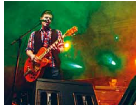
Samstag, 19.36 Uhr: Die Luzerner Indie-Veteranen von Mothers Pride eröffnen.