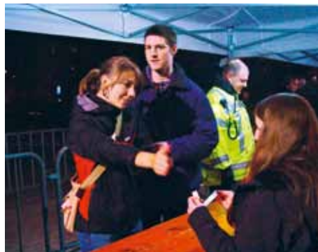
Samstag, 19.00 Uhr: 1600 Jugendliche strömen in die Horwerhalle – ohne Zwischenfälle.