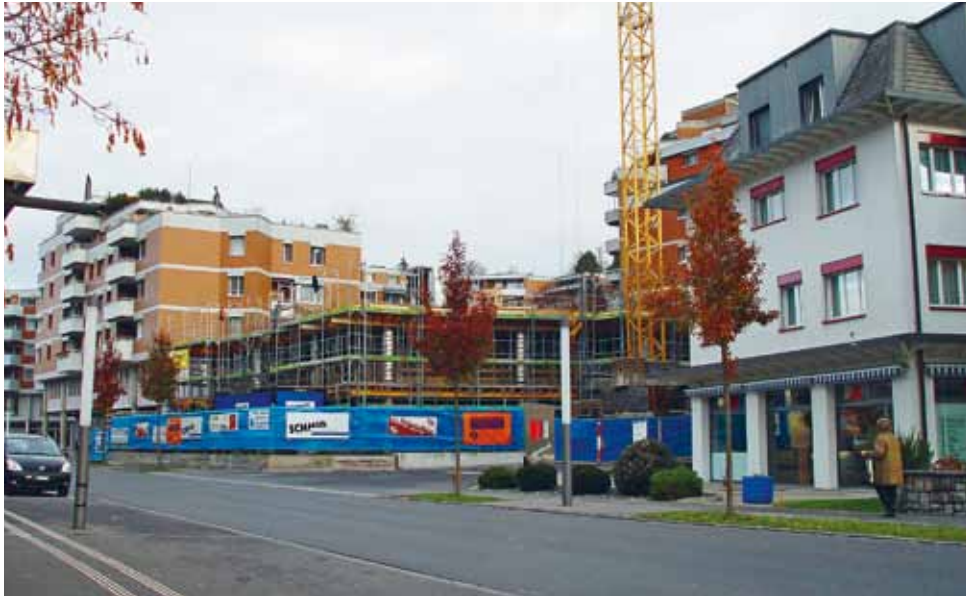
Aktuelle Baustelle: An der Kantonsstrasse 53 wird ein Wohn- und Geschäftshaus gebaut.