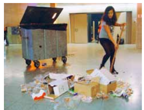
Sonntag, 02.45 Uhr: Jugendliche beim grossen Aufräumen.