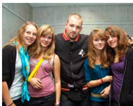
Sonntag, 01.11 Uhr: Einige ganz Glückliche lassen sich nach dem Konzert mit Stress ablichten.