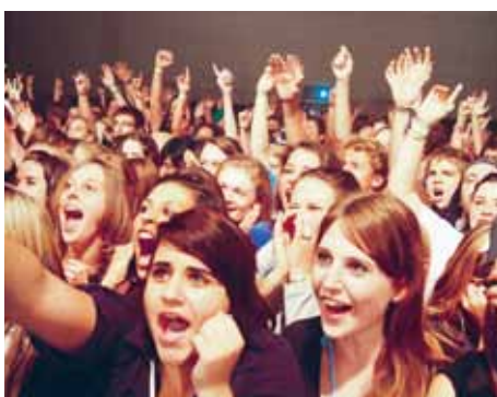
Sonntag, 00.25 Uhr: Stress begeistert, die 1600 Fans sind nicht mehr zu bremsen!