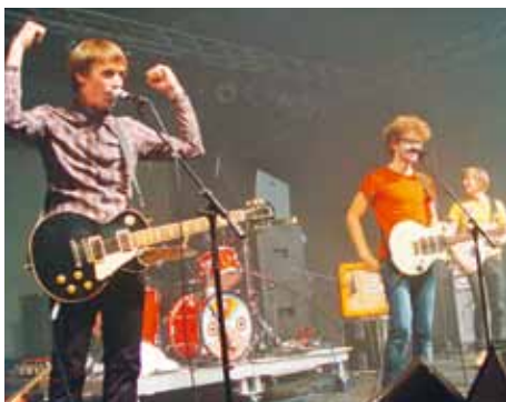
Samstag, 20.50 Uhr: Die Band 7 Dollar Taxi heizt den Horwern tüchtig ein