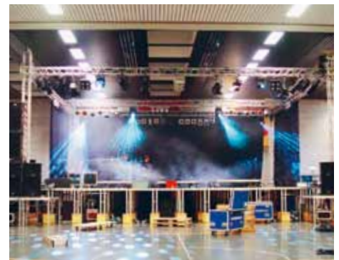
Samstag, 8.40 Uhr: «Tonart» und «Eventmedia» rücken die Bühne ins richtige Licht.