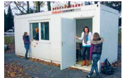
Neuer Raum für die Jugend.