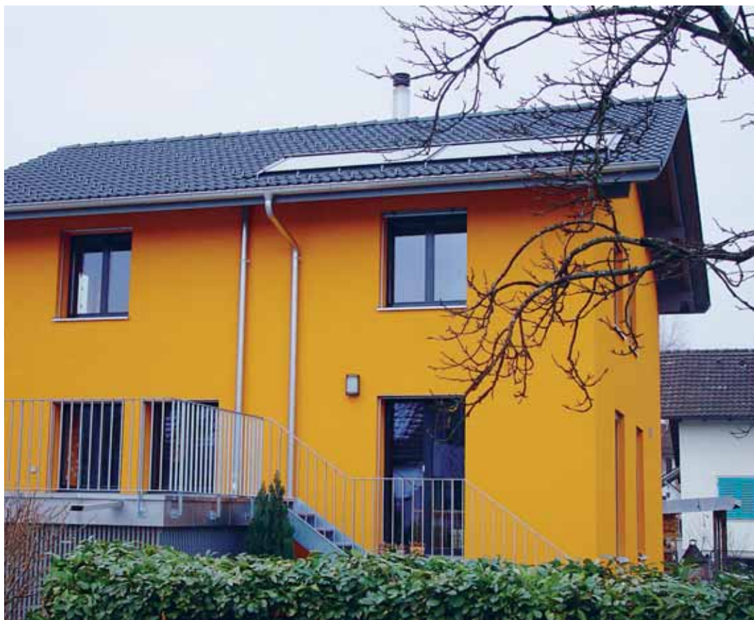
Sonnenkollektor auf dem Einfamilienhaus Wegmattstrasse 15 in Horw: Ein Beispiel einer von Horw geförderten Energiesparmassnahme.

Im Gegensatz zu Sonnenkollektoren, welche Warmwasser produzieren, wird bei Photovoltaikanlagen Sonnenenergie in elektri-