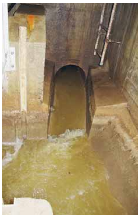
Zum Beispiel Energiestadt Horw: Abwasseranlage.

Im 2011 findet eine Überprüfung statt. Die Energiestadt Horw muss beweisen, dass sie die erforderlichen Punkte für das Label immer noch besitzt. Ziel dabei ist in erster Linie der Erhalt des Labels und nach Möglichkeit eine Steigerung der Punktezahl seit der Labelübergabe im 2007 zu erreichen. Der Prozess wird von der Umweltschutzstelle und dem Energiestadtberater begleitet. Zusammen mit der Erfolgskontrolle für das energiepolitische Programm 2007 bis 2010 wird auch ein Folgeprogramm erarbeitet, welches vom Einwohnerrat genehmigt werden muss.