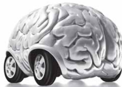
Intelligente Technik kann Leben retten.

Grundsätzlich sieht der Gesetzgeber vor, dass Verstösse dagegen durch die Mitarbeiter der Werkdienste beseitigt werden können. Der Grundstückbesitzer hat für die Kosten aufzukommen. Vorher werden die Grundstückbesitzer auf ihre Pflicht aufmerksam gemacht.