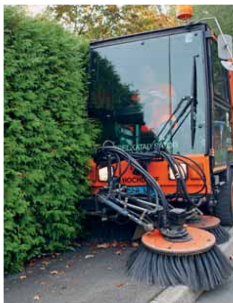
Wild wuchernde Hecken können die Strassenreinigung stark behindern.

Der Gesetzgeber macht diesbezüglich klare Vorgaben wie hoch und breit Hecken und Bäume entlang von öffentlichen Wegen und Strassen sein dürfen: