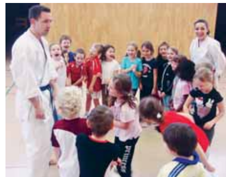
Karate, keine todernste Sache!

Das Jahresmotto des Horwer Oberstufenschulhauses heisst PFIGUGEGL (Positives Feedback ist gut und gibt eine gute Laune). In diesem Sinne will das Oberstufenschulhaus eine Aktion starten, um dieses Motto hinaus in die Gemeinde zu tragen. An diesem Donnerstag schreiben die Schülerinnen und Schüler klassenweise gute Wünsche und positive Bemerkungen auf Postkarten. Anschliessend werden diese Postkarten an Ballone befestigt und gemeinsam himmelwärts geschickt... Die Bevölkerung ist herzlich eingeladen bei der Ballonabgabe dabei zu sein. Am Rande der Veranstaltung üben drei Klassen des 8. Schuljahres mit Verantwortlichen der Kantonsschule Musegg zwei verschiedene Musicals ein und geben um 15.45 Uhr eine Aufführung. Auf dem Programm stehen «Mama mia» und «We will rock you».