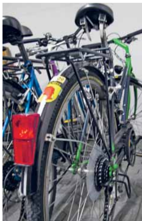
Zum Beispiel Energiestadt Horw: Personal fährt Velo.