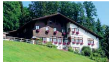
Der «Schwendelberg» ist neu verpachtet.