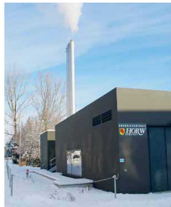
Zum Beispiel Energiestadt Horw: Energiezentrale Allmend.