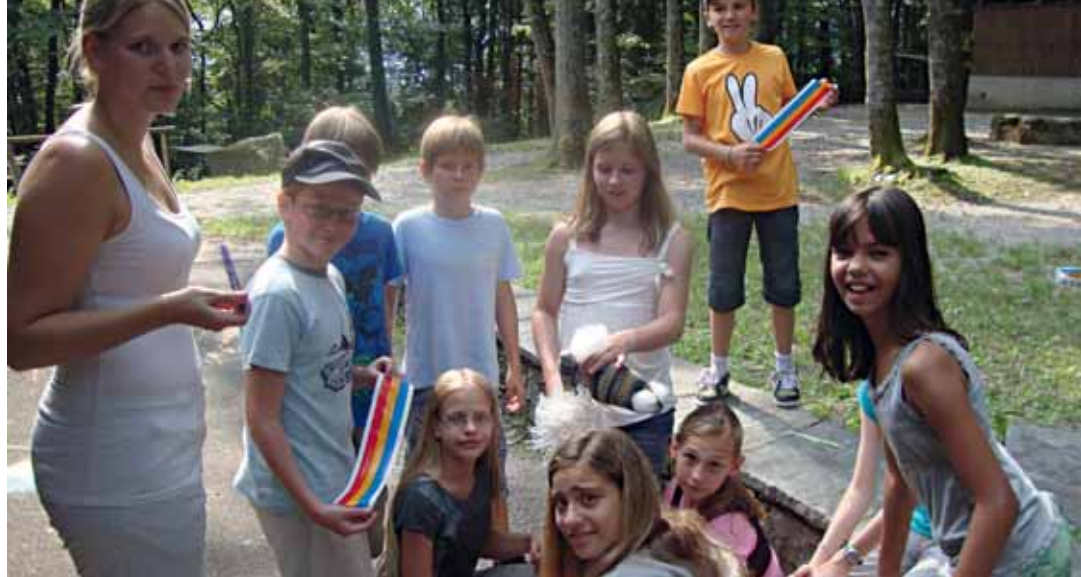
Das Lager 2011 in Arcegno im Tessin wurde von über 50 Kindern aus der 4. bis 6. Primarklasse besucht.