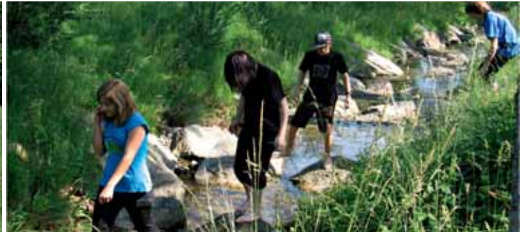
Aufnahmen aus einem früheren Gesundheitsprojekt der Sekundarschule I.