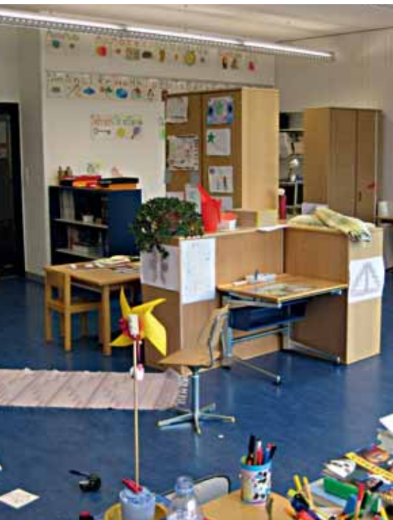
Ab dem Sommer gibt es in weiteren Kindergärten und Primarschulen die Integrative Förderung.

Mit dem Beginn des neuen Schuljahres im August 2012 wird in den Kindergärten und Primarklassen der Schulhäuser Allmend, Hofmatt und Spitz die Integrative Förderung (IF) eingeführt, d.h. die Kinder und Jugendlichen mit besonderem Förderbedarf bleiben in den Regelklassen integriert. Ende Schuljahr werden somit die bestehenden Einführungs- und Kleinklassen aufgelöst. Die Schule als Ganzes geht vom Grundsatz aus: «Integration vor Separation». Auch Integrative Sonderschulungen (IS) sind möglich. Im Schulhaus Mattli in Kastanienbaum wird die Integrative Förderung bereits seit mehr als zehn Jahren praktiziert.