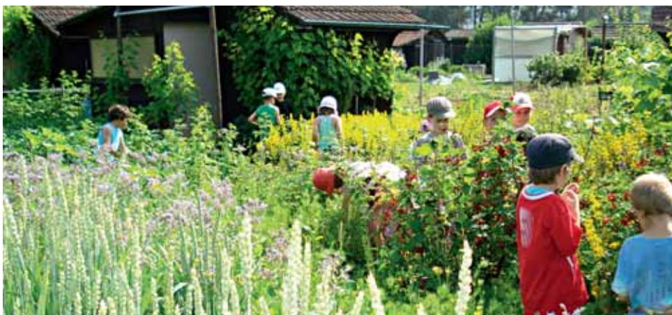
Der Naturgarten lädt zum Entdecken ein und ist ein Paradies für Menschen und Tiere.

Um 11.30, 13.00 und 14.00 Uhr zeigen talentierte Biker des Velo-Trial Club Zürich auf dem Gemeindehausplatz an einer Trial-Vorführung ihr Können.