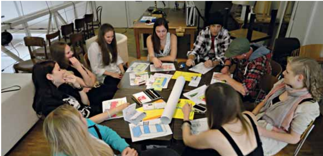
Die Jugendlichen diskutierten an einem Nachmittag intensiv über die Nutzung des Rüteli.

Am 31. März 2012 trafen sich am Nachmittag 35 junge Horwerinnen und Horwer mit 10 Erwachsenen aus der Politik, der Jugendkommission und Anwohnenden der Rüteliwiese zum Austausch in der Zwischenbühne. Dieser Jugendmitwirkungs-Tag hatte zum Ziel, Ideen und Anregungen für den Sommerbetrieb des Rüteliwagens zu sammeln.