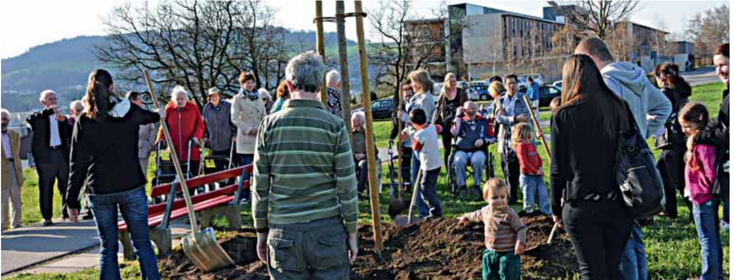
Gross und Klein greift zur Schaufel: Das Kirchfeld bekam zum 10-Jahre-Jubiläum eine Linde.