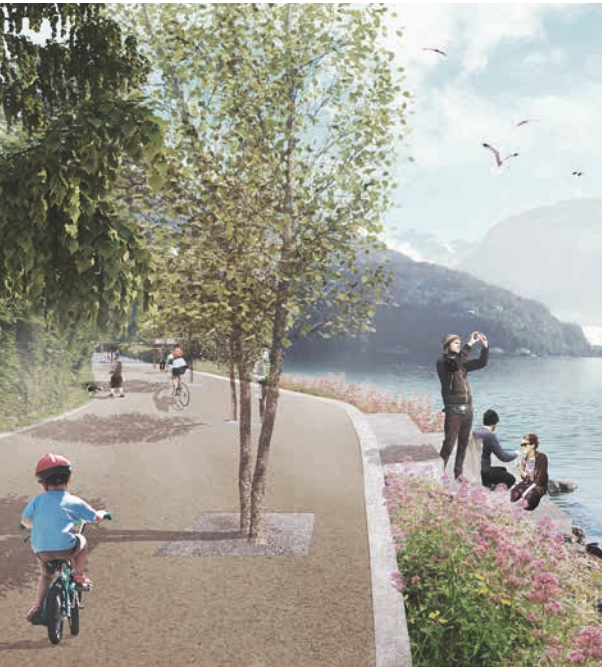
Die neu gestaltete Seestrasse auf der Höhe der Spissenegg (Visualisierung).

Die Winkel- und Seestrasse zwischen Horw Rank und Kastanienbaum soll im Zug der nötigen Sanierung aufgewertet werden. Ziel ist, durch die Neugestaltung Nutzungskonflikte zu entschärfen und die Sicherheit zu verbessern.